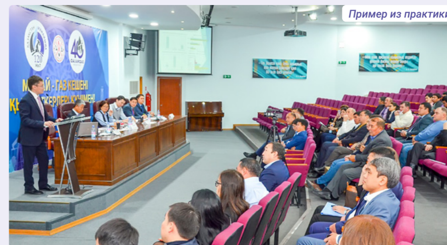
Пример из практики

В качестве мер поддержки казахстанского товаропроизводителя при закупках отдается приоритет отечественным товаропроизводителям и товаропроизводителям холдинга, при заключении договоров – программам «Поддержка новых производств» и «Экономика простых вещей».