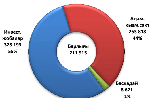
2014 ж. 1 жартыжыл. капиталдық шығындар, млн.теңге

2014 жылдың 1 жартыжылдығында ҚМГ капиталдық шығындары 211,9 млрд. теңгені құрады. Компанияның инвестициялық жобаларының негізгі бөлігі (КВЛ жалпы сомасының 55%) ҚР МӨЗ жаңғырту жобаларын, Солтүстік Каспий жобасын, Қытайға экспорттық бағытта мұнай тасымалдаудың өткізу қабілетін ұлғайту жобасын және басқа инвестициялық жобаларды іске асыруға жатады.